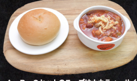
A・B・Cセットのスープはナカティサイズです。

スモークサーモンサンドのセットは+100円(税別)となっております。ベーグルを+20円(税別)でガーリックトーストに!