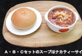
A・B・Cセットのスープはナカティサイズです。

スモークサーモンサンドのセットは+100円(税別)となっております。ベーグルを+30円(税別)でガーリックトーストに!